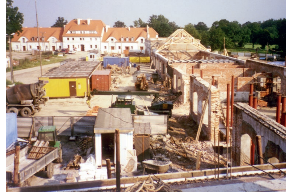
Das ehemalige Gut wird in den 90er Jahren umfassend renoviert. Im Hintergrund der Pferdestall war das erste Gebäude, das 1994 mit Spendengeldern der Kreisau-Initiative fertiggestellt wurde.