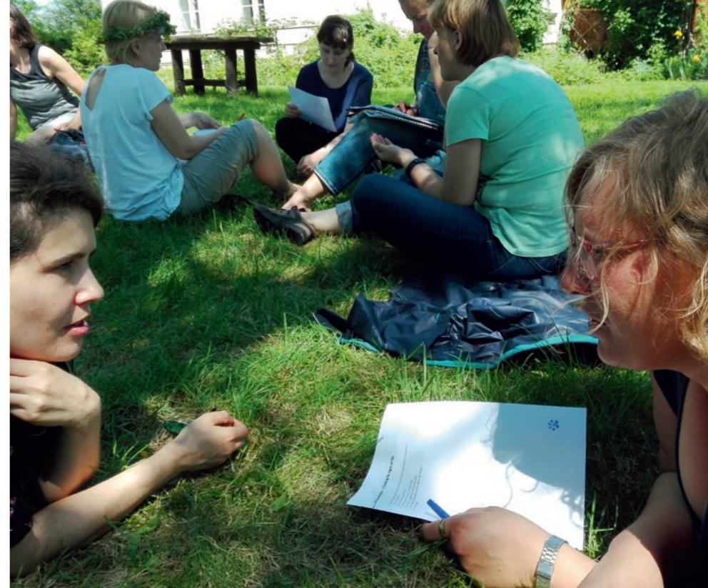
Kreisau/Krzyżowa bietet einen geschützten Raum zum Austausch – Teilnehmer*innen des Fortbildungsprojekts „Mut zum Wandel, Mut zum Handeln“.

Für die Zukunft scheinen mir dazu drei Gedanken wichtig zu sein. Zum einen müssen wir in den Mittelpunkt unserer Projekte die Frage stellen, wie wir diese Menschen dazu ermutigen und dabei unterstützen können, Verantwortung zu übernehmen. Wir mögen vielleicht quantitativ in unserer Wirksamkeit beschränkt sein, aber für die Teilnehmer*innen, die an unseren Projekten teilnehmen, kann diese Erfahrung in ihrem Leben prägend werden. Dabei rückt aus meiner Sicht zweitens mit den „kleinen Gemeinschaften“ ein Begriff aus dem Kreisauer Kreis in den Blick, der an Aktualität nichts eingebüßt hat. Modern gesprochen, können wir mit unserer Arbeit „Communities of practice“ stiften, also transnationale Gemeinschaften von Menschen, die sich für ähnliche Themen einsetzen, voneinander lernen und sich gegenseitig unterstützen. Diese können einen Raum eröffnen, in dem Verantwortungsübernahme erlebt und erlernt, gerade auch jungen Menschen das Mittun ermöglicht werden kann. Der Grundstein für eine solche Arbeit ist in unserem Partnernetzwerk und den thematischen Schwerpunkten – Inklusion,