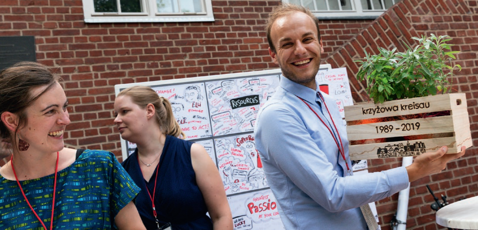
Zu einem Geburtstag gehören auch Geschenke – das Team freut sich.