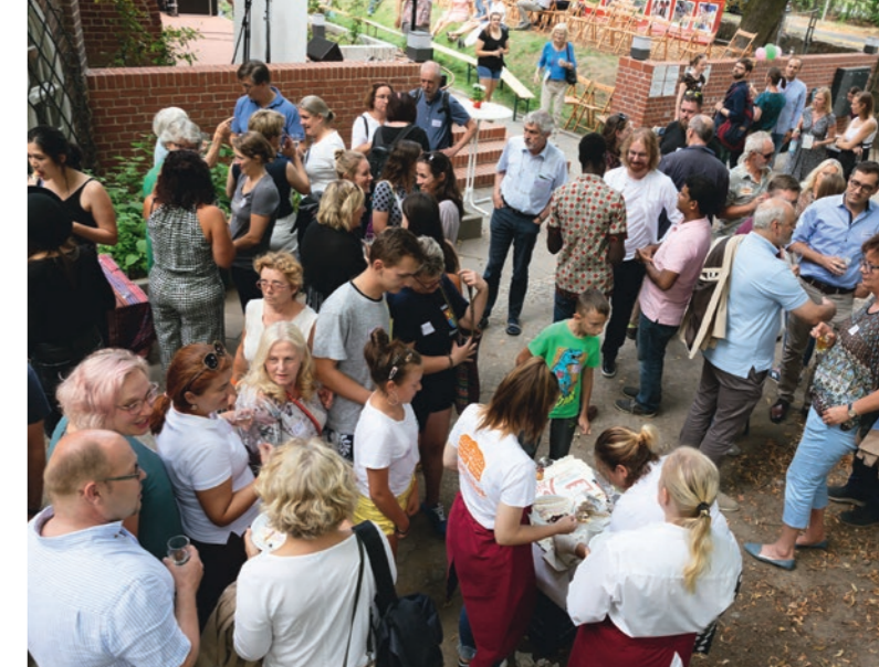
Zahlreiche Freunde und Partner feierten mit uns ein rauschendes Sommerfest.