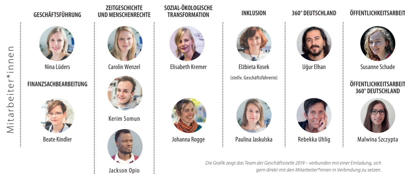
Die Grafik zeigt das Team der Geschäftsstelle 2019 – verbunden mit einer Einladung, sich gern direkt mit den Mitarbeiter*innen in Verbindung zu setzen.

Die Arbeit der Kreisau-Initiative erfährt viel Wertschätzung von Partnern und Förderern. Auch im Jahr 2019 erhielten wir für unsere Netzwerkaktivitäten im Bereich Jugend einen Betriebskostenzuschuss aus dem Programm Erasmus+ der Europäischen Union. Wir sind Zentralstelle des Deutsch-Polnischen Jugendwerks (DPJW). Unsere Expertise ist gefragt; so wurden wir eingeladen, erneut im Beratungsteam des Programms „Europeans for Peace“ der Stiftung „Erinnerung, Verantwortung und Zukunft“ mitzuarbeiten. Die Fachstelle Internationale Jugendarbeit der Bundesrepublik Deutschland (IJAB) lädt uns regelmäßig für Vorträge ein. Und auch die deutsche Nationalagentur des Programms Erasmus+ bat uns bei verschiedenen Konferenzen um Beiträge.