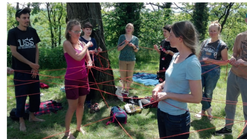
Vernetzte Natur: Teilnehmende an der Methodenfortbildung Erlebnispädagogik (im Rahmen von „Mut zum Wandel, Mut zum Handeln“) machen sich ökologische Zusammenhänge bewusst.

Das vergangene Jahr war von einer Mischung aus Kontinuität und Neuem geprägt: Das bewährte Projekt „Local in Global“ ging in eine neue Runde, gleichzeitig wurde das in den letzten Jahren immer wieder angepasste und verbesserte Planspiel „Krapowa“ in seiner aktuellen Form als Publikation aufbereitet und so für die Nutzung in anderen Kontexten zugänglich gemacht (s. unten). Das 2018 begonnene Projekt „Mut zum Wandel, Mut zum Handeln“ hat in einer Reihe von Trainings – von Wachstumskritik über Ernährungssouveränität bis hin zu erlebnispädagogischen Methoden in der BNE – Multiplikator*innen aus Deutschland und Polen für eigenständige Bildungsarbeit im Sinne von BNE, Transformativem Lernen und Degrowth-Bildung befähigt. Ein Fachtag zu nachhaltigen Lernumgebungen im Rahmen des Projektes trug im November weiter dazu bei, deutsche und polnische Akteure im BNE-Bereich zu vernetzen und den Diskurs zu bereichern. Ein Novum 2019 war das Projekt „Die Waldakrobaten“, das sich an 8- bis 12-Jährige richtete und eine Brücke zwischen Naturerkundung und Kreativmethoden schlug. Daneben haben wir als Team auch über den Tellerand geschaut und uns über klassische Projektformate hinaus