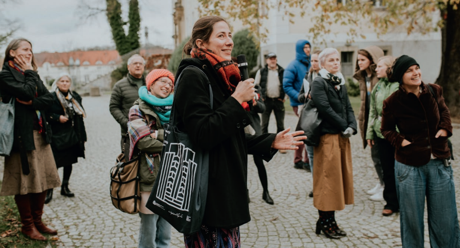
Während des Fachtags „Gesagt, getan?“ tauschen sich die Teilnehmer*innen über nachhaltige Lernumgebungen aus.