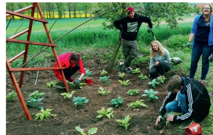
Jugendliche aus dem Fachaustausch „Für den Garten in Kreisau“ gestalteten eine Rosenpergola am Berghaus.

guter Praxis für inklusive und diverse Jugendarbeit sind. Inspiriert dadurch entstanden neue Projektformate mit neuen Feldern, so z. B. das Thema „psychische Gesundheit“, das ab 2020 fester Bestandteil unserer Bildungsaktivitäten werden wird. Auch das „Kreisauer Modell“ begleitet uns weiter und ist ein etabliertes internationales Format für Fachkräfte, die sich im Bereich inklusiver internationaler Bildung weiterentwickeln