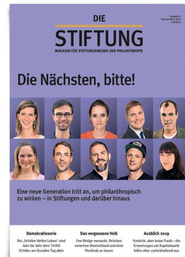
Das Magazin Stiftung hat über die Jungen StifterInnen berichtet.

Die Kreisau-Initiative und die Stiftung Kreisau teilen sich in diesem Jahr mit dem Mauerfall und der Kreisauer Versöhnungsmesse ihre stolzen 30-jährigen Jubiläen. Die Freya von Moltke-Stiftung freut sich auf ihren 15. Geburtstag im kommenden Jahr und Krzyżowa-Music kann auf eine erfolgreiche Saison zurückblicken. Von herausragender Bedeutung war ganz besonders der 1. September, der Tag unseres Abschlusskonzerts, da er auf den 80. Jahrestag des Ausbruchs des 2. Weltkrieges