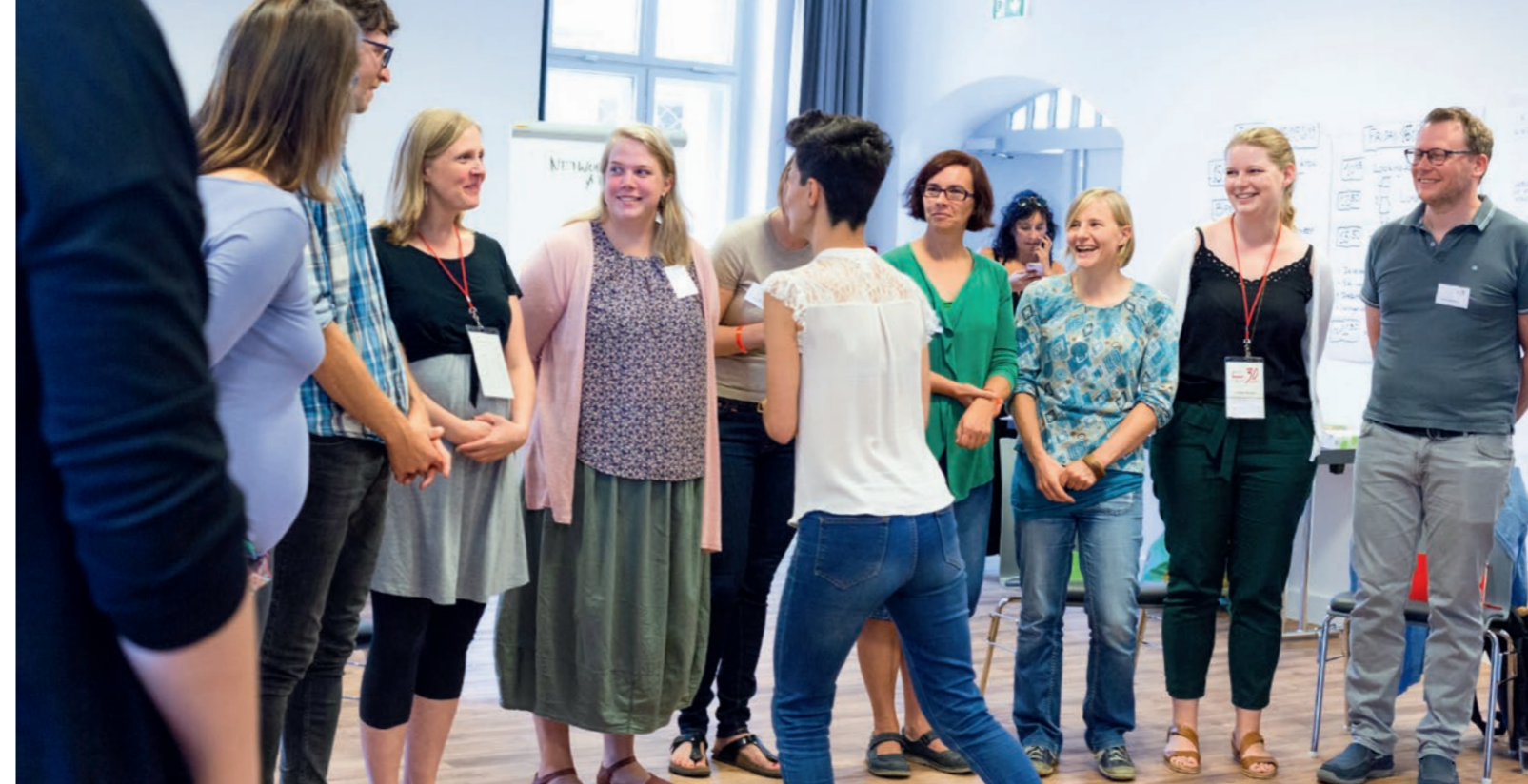
Die internationalen Netzwerkpartner der Kreisau-Initiative lernen sich kennen.