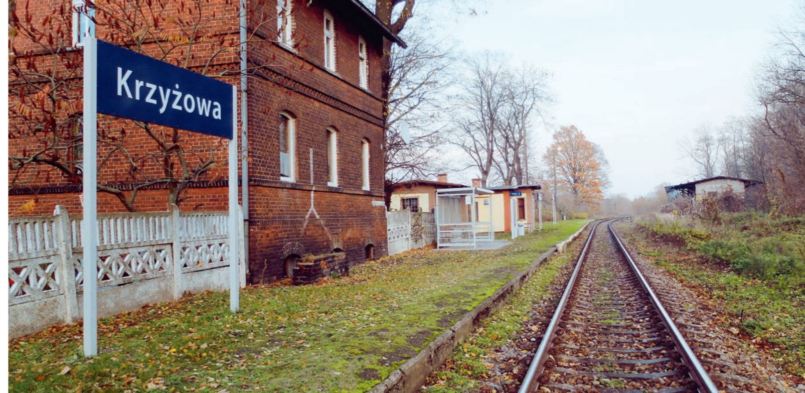
Bahnhof Krzyżowa.