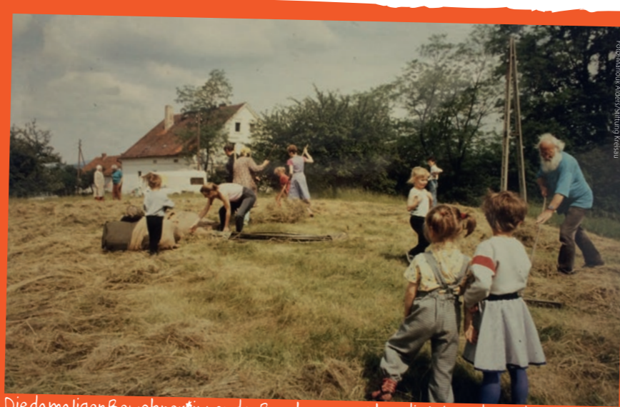
Die damaligen Bewohner*innen des Berghauses mähen die Wiese, damit die Teilnehmer*innen am Workcamp dort ihre Zelte aufschlagen können.