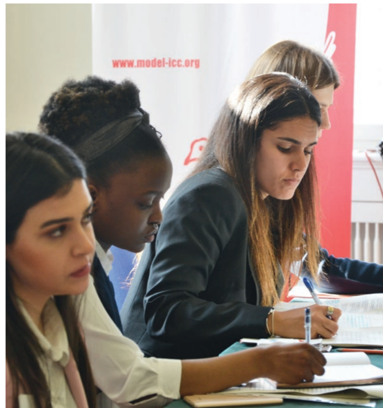
Das Projekt „Model International Criminal Court“ wurde zum ersten Mal 2005 durchgeführt.

Kreisau, einem Ort, an dem junge Menschen aus ganz Europa im Gedenken an jene mutigen Menschen des Widerstands zusammenkommen können, günstig. Im Jahr 2019 feierten und würdigten wir alle, die dies möglich machten.