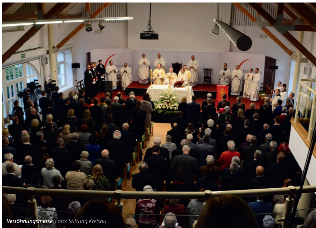
Versöhnungsmesse.