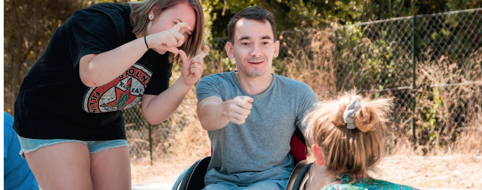
Die Teilnehmer*innen des „Brückenschlages“ in Griechenland setzten sich mit dem Thema Vielfalt in u. a. theaterpädagogischen Methoden auseinander.

Bei der Kreisauer Geschichte angekommen, ist es wichtig, ein Mitglied hervorzuheben, dessen Erbe einen starken Einfluss darauf hatte, dass die inklusive Bildungsarbeit im Kreisauer Netzwerk so tief verwurzelt ist. Adolf Reichwein war ein bedeutender Reformpädagoge seiner Zeit, der unterschiedliche internationale pädagogische Ansätze nutzte, um innovative Bildungskonzepte umzusetzen. Dabei entwickelte er unter anderem die Ansätze von Johann Heinrich Pestalozzi weiter, der Bildung für alle forderte und das Lernen mit Kopf, Herz und Hand