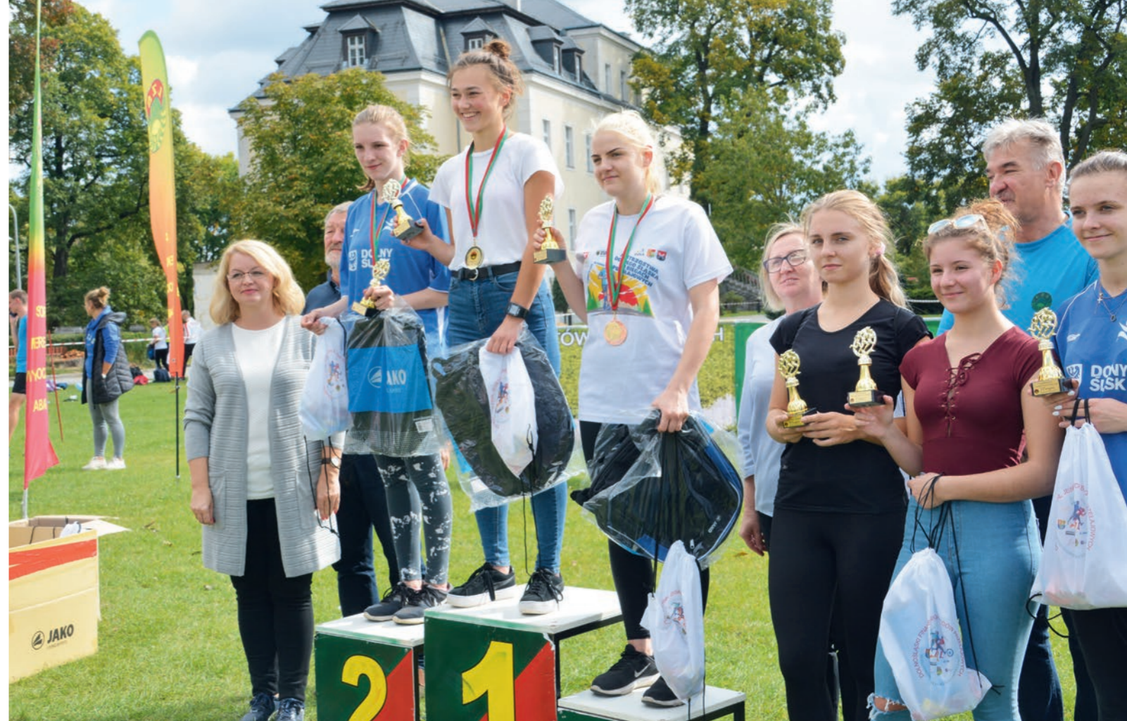
6. Versöhnungslauf Stiftung Kreisau