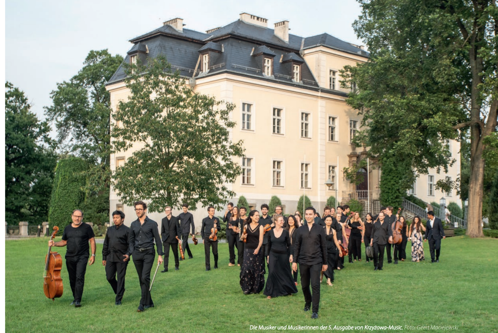
Die Musiker und Musikerinnen der 5. Ausgabe von Krzyżowa-Music.

Das was Krzyżowa-Music über die acht Konzerte in Kreisau und Niederschlesien hinaus so attraktiv für viele Besucher macht, ist die Möglichkeit ganz tief in das Geschehen einzutauchen: so können alle Proben besucht werden. Vom ersten Durchspielen der über 40 Werke, die in Kreisau erarbeitet werden, kann über die zisierte Feinarbeit an den Details in den weiteren Sitzungen bis hin zur Generalprobe ein ganz vertieftes Werkverständnis entstehen, das dann in den Konzerten zuhörend voll ausgekostet werden kann. Wann allerdings die