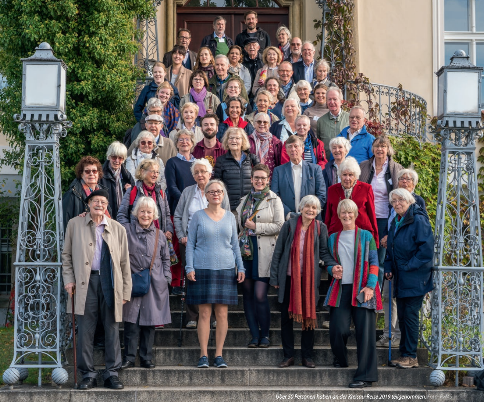
Über 50 Personen haben an der Kreisau-Reise 2019 teilgenommen.

StifterInnen-Kreises, der als positives Beispiel für die Nachwuchsarbeit von Stiftungen vorgestellt wurde. Beide Artikel können Sie auf unserer Webseite nachlesen.