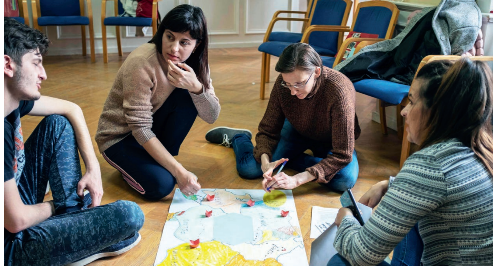
Bei dem Training „Once upon today... in Europe – (Y)our 1989!“ ging es um persönliche Geschichten rund um das Transformationsjahr 1989.