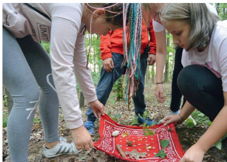
Was gibt es alles im Wald zu entdecken? – Teilnehmende des Projekts „Waldakrobaten“.

gen – dies sind auch wesentliche Elemente einer zukunftsfähigen und solidarischen Gesellschaft, wie sie in der solidarischen Landwirtschaft, Kooperativen oder den Transition Towns bereits gelebt werden. Das zeigt, wie hochaktuell die Gedanken der Kreisauer immer noch sind.